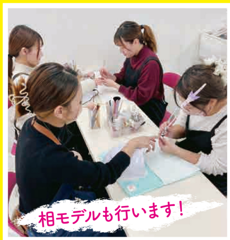
相モデルも行います!