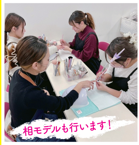
相モデルも行います!